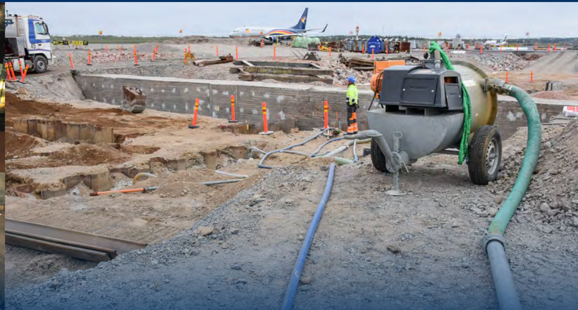
POHJAVEDEN SUOJAUS JA ALENNUS