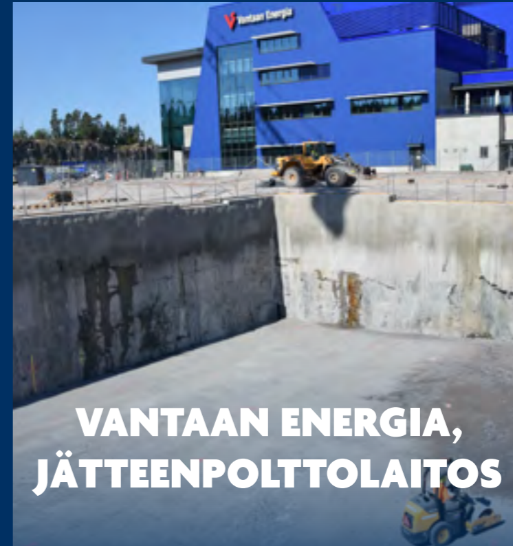
VANTAAN ENERGIA, JÄTTEENPOLTTOLAITOS VANTAA