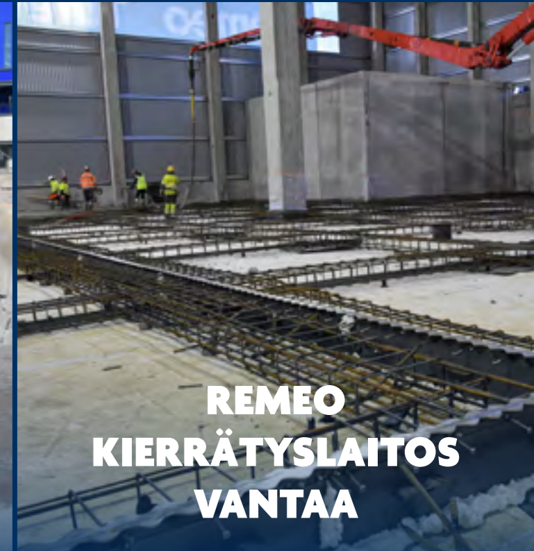
REMO KIERRÄTYSLAITOS VANTAA