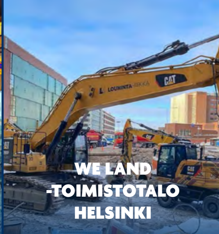
WE LAND -TOIMISTOTALO HELSINKI