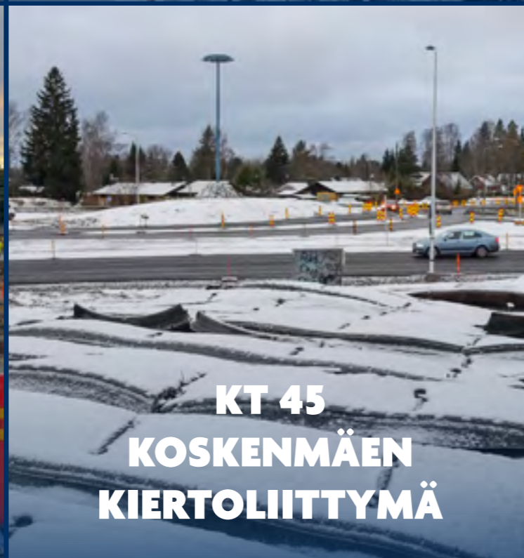
KT 45 KOSKENMÄEN KIERTOLIITYMÄ