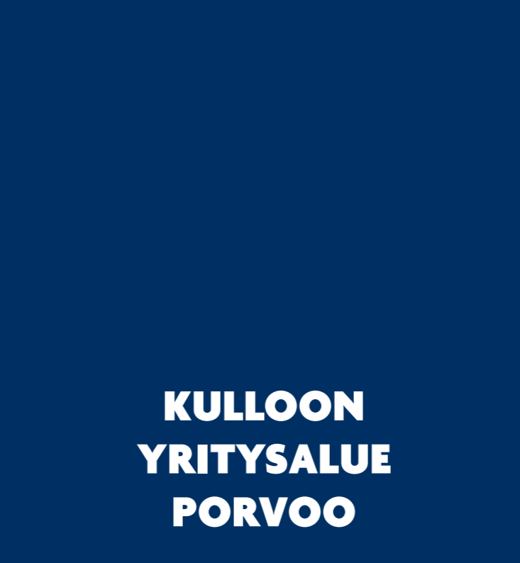
KULLOON YRITYSALUE PORVOO