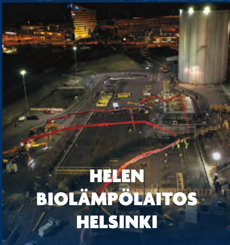
HELEN BIOLÄMPÖLAITOS HELSINKI