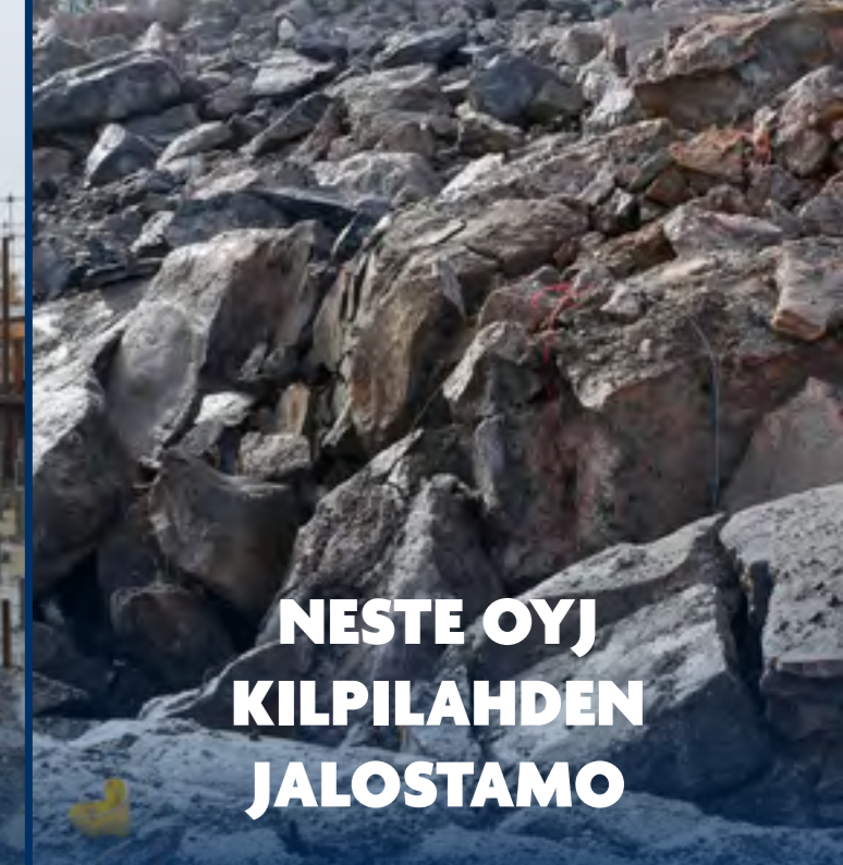
NESTE OYJ KILPILAHDEN JALOSTAMO