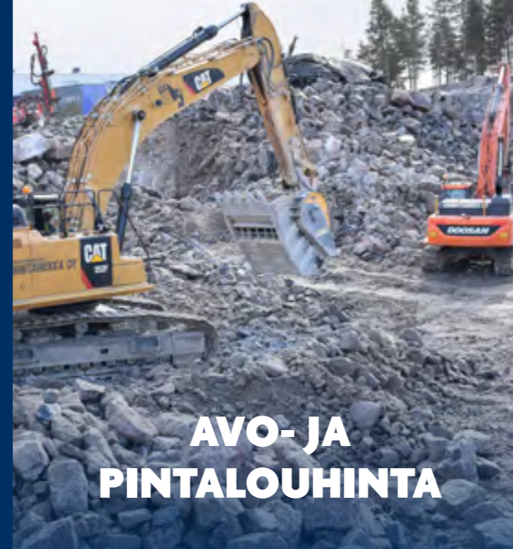
AVO- JA PINTALOUHINTA

Tarjoamme louhintapalvelut avolouhinnoista rakennuksen sisäpuolisiin louhintoihin ja erikoismenetelmiin yhdessä kattavan kumppanuusverkoston kanssa. Motivoituneen henkilöstömme ja nykyaikaisen kalustomme ansiosta pystymme täyttämään asiakkaamme tiukatkin vaatimukset.