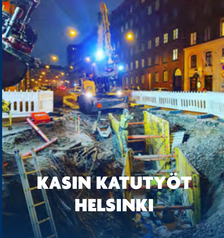
KASIN KATUTYÖT HELSINKI