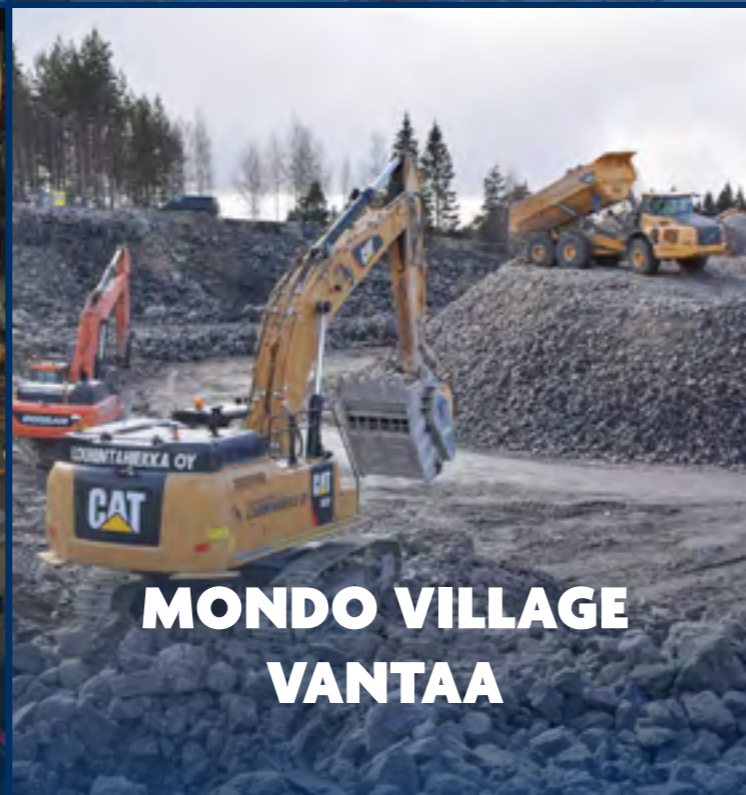
MONDO VILLAGE VANTAA