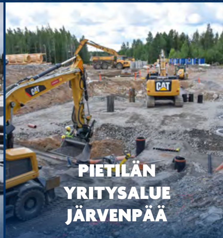
PIETILÄN YRITYSALUE JÄRVENPÄÄ