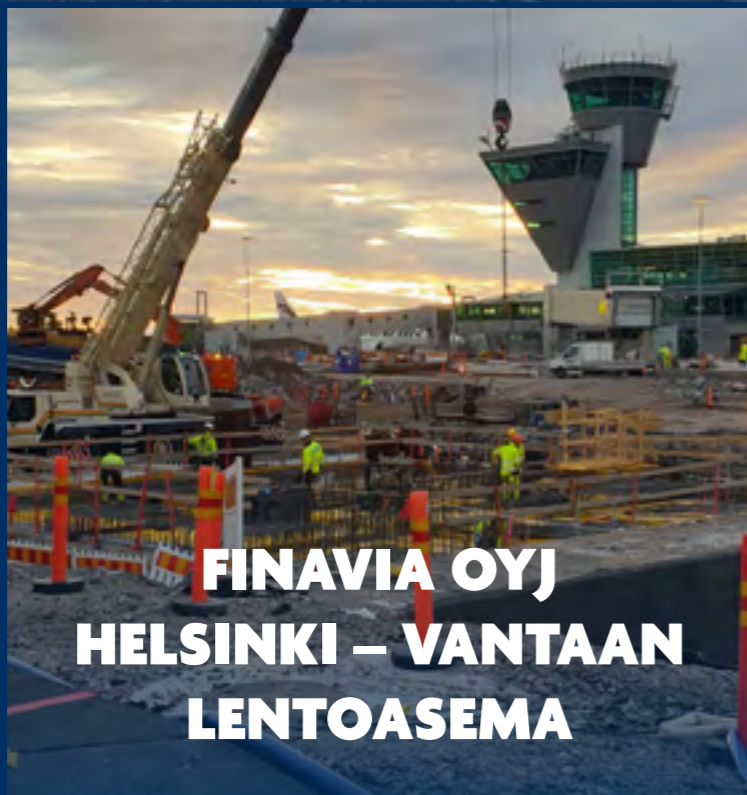
FINAVIA OYJ HELSINKI – VANTAAN LENTOASEMA