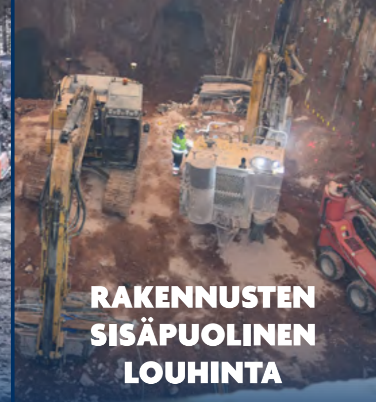
RAKENNUSTEN SISÄPUOLINEN LOUHINTA