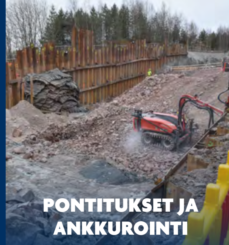
PONTITUKSET JA ANKKUROINTI

kustannustehokkaimman ja turvallisen lopputuloksen asiakkaamme hankkeeseen.