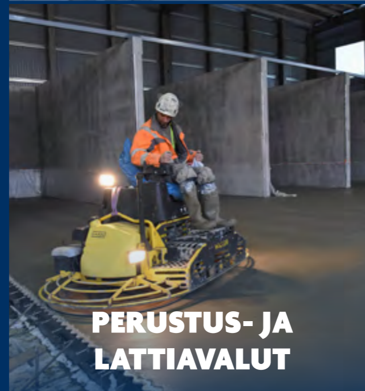
PERUSTUS- JA LATTIAVALUT