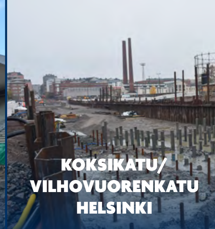
KOKSIKATU/ VILHOVUORENKATU HELSINKI