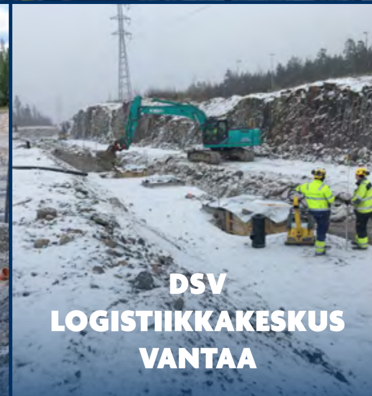
DSV LOGISTIKKAKESKUS VANTAA

Lisää referenssi kohteita: louhintahiekka.fi