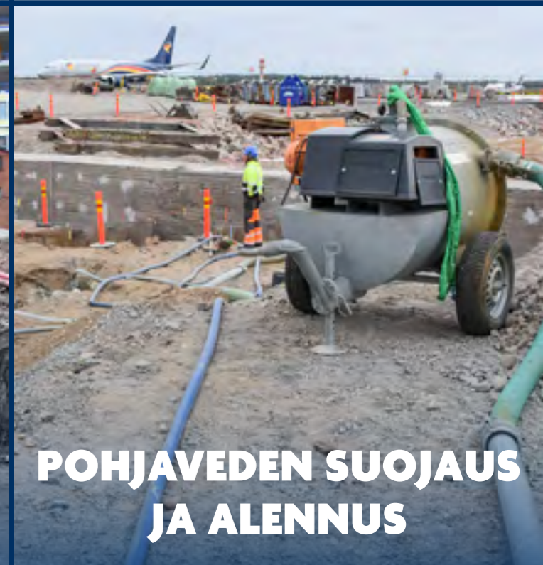
POHJAVEDEN SUOJAUS JA ALENNUS