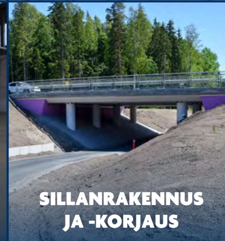
SILLANRAKENNUS JA -KORJAUS