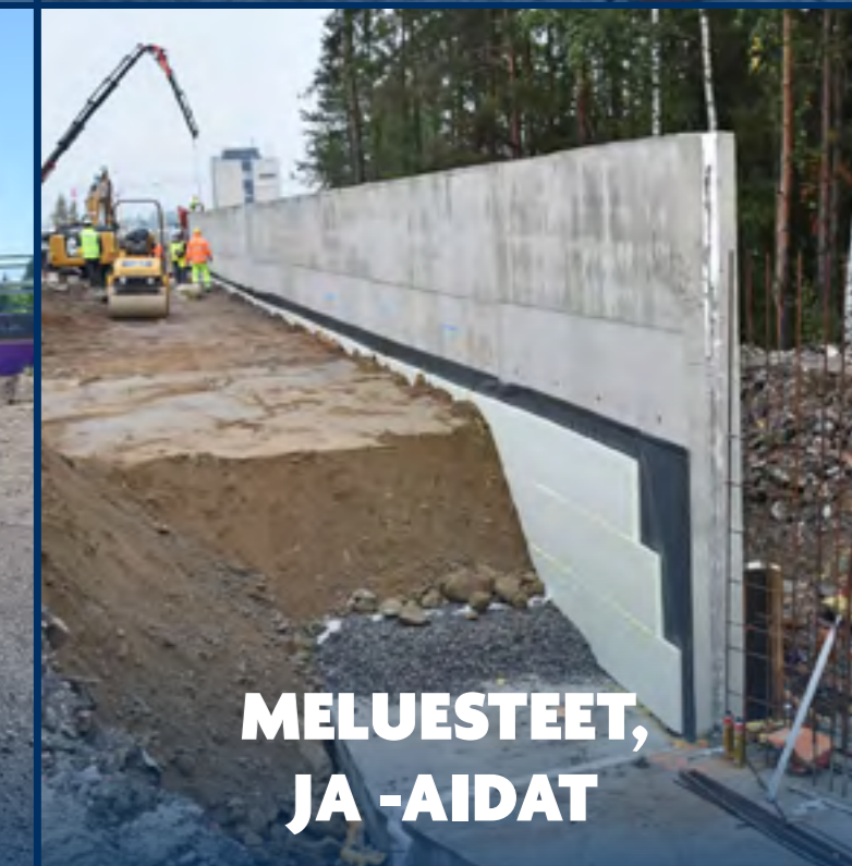
MELUESTEET, JA -AIDAT